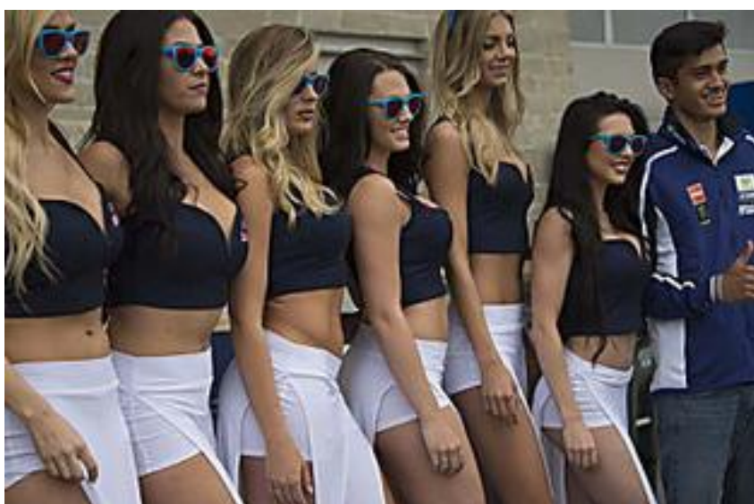
Grands prix : quand les grid girls font le show ! (Automoto, magazine auto et moto)