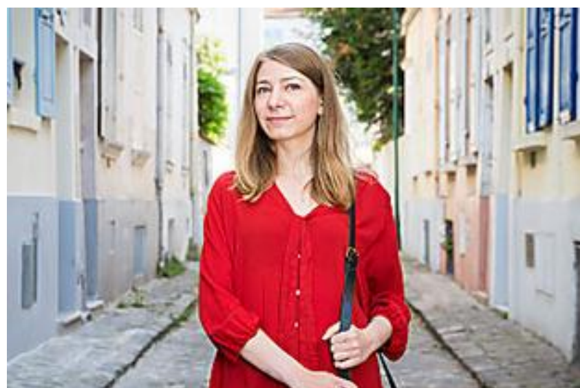
Non imposable, je serai prélevée en 2019? (www.economie.gouv.fr)