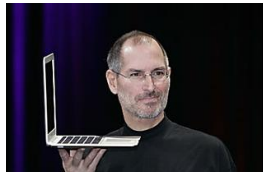
Les « 10 meilleurs » mac antivirus de 2018 (Vous ne devinez jamais lequel est n°1) (My Antivirus Review)